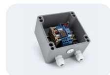
Verteilerbox Strom & CAN