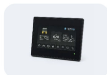
CR1142 4,3" Touch Display