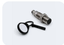
RFID Sensor & Tags