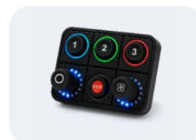
Tastenfeld Von 4 bis 15 Tasten