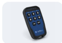
Funk Pocket oder Rocketflex