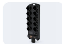
CR20xx I/O Modul