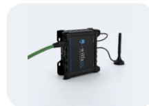
Router VPN & Portallösung